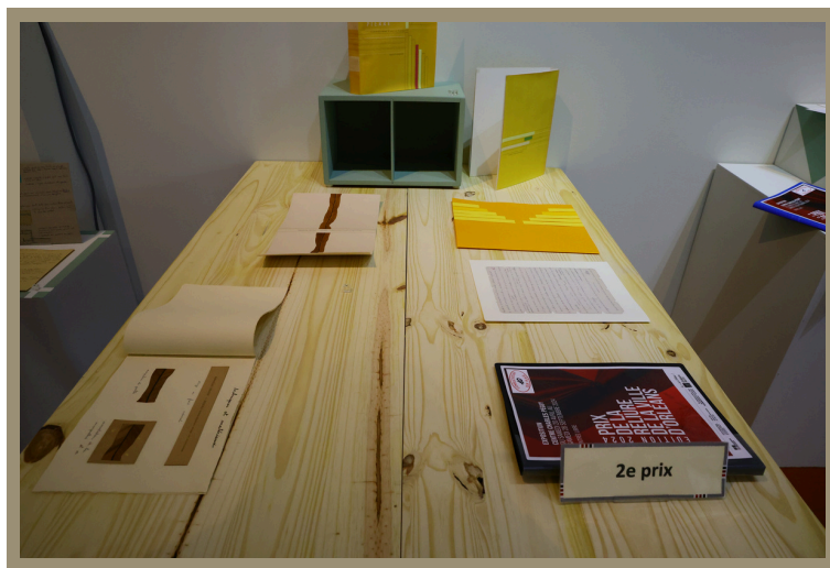
À droite projet d'Eva Vincze, 2e Prix, à gauche projet de Béatrice Saillard

Le projet présenté par Eva Vincze, d'une grande cohérence esthétique et d'une très haute qualité technique, notamment de la structure, a aussi emporté de nombreux suffrages.